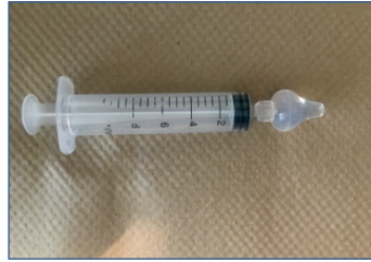
Seringue avec connecteur nasal