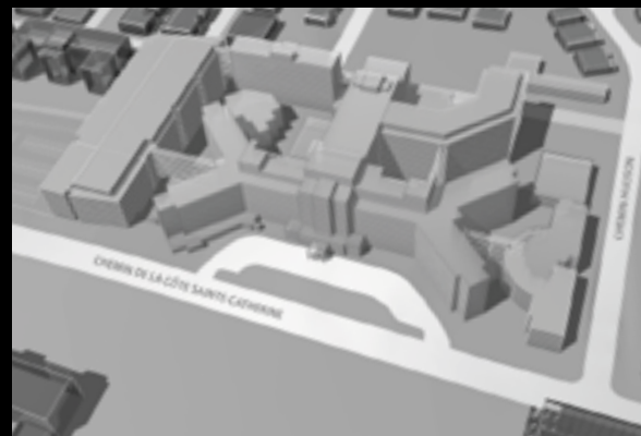
MERCI AU PUBLIC ET AUX ORGANISMES DONT LES CONTRIBUTIONS À CE PROJET D'ENVERGURE S'ÉLEVENT À 125 MILLIONS DE DOLLARS.

De mettre en place un véritable Centre du savoir permettant d'offrir une formation médicale et aux professionnels de haut niveau, ainsi qu'une formation continue et des activités de formation au grand public.