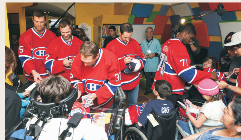
Une première cette année, neuf patients du Centre de réadaptation Marie-Enfant ont eu la chance de rencontrer eux aussi leurs idoles à la Tanière du Lion au 5 e bloc 5.