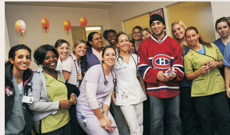
Scott Gomez n'a pas hésité à se faire photographier avec ses admiratrices du 7 e bloc 3!