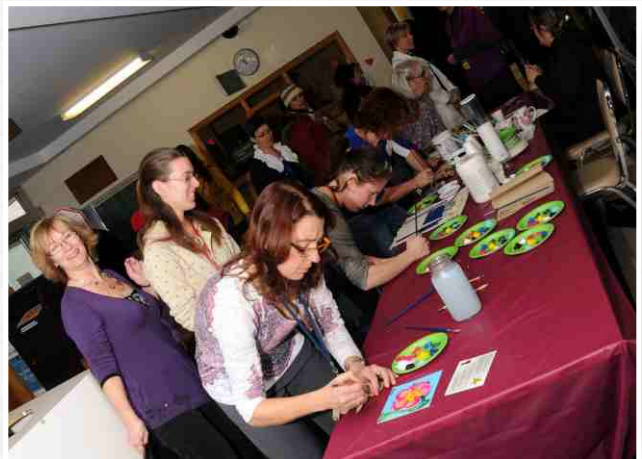
Les employés du CRME ont eu beaucoup de plaisir à faire valoir leur talent lors de l'activité murale.