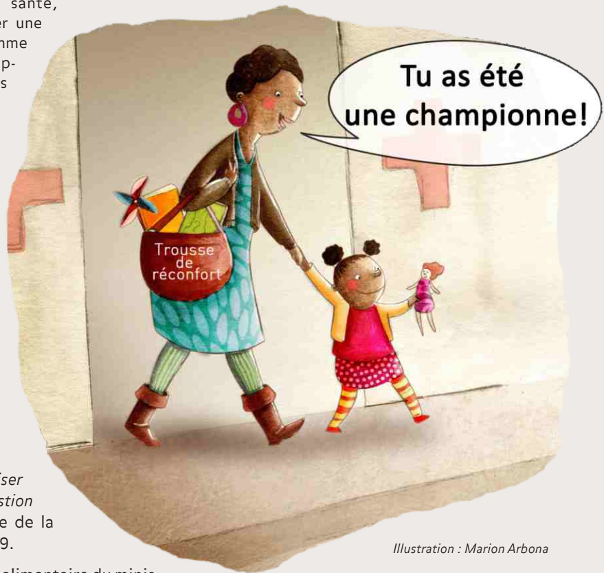
Illustration : Marion Arbona

L'équipe de nutrition clinique et du Service de diététique ont préparé un riche programme d'activités et d'information à l'intention du personnel et de la clientèle du CHUSJ, qui se déroulera tout au long du mois de la nutrition. D'autres projets sont également sur la table pour l'année à venir. A nous d'en profiter au maximum.