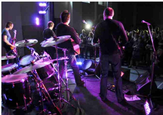
Le groupe « Les Just-In » ont offert une performance électrisante devant un public conquis!