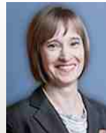
Hélène Boisjoly Doyenne, Faculté de médecine Université de Montréal UNIVERSITÉ DE MONTRÉAL